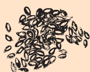
Brytyjskie brązowe siemię lniane